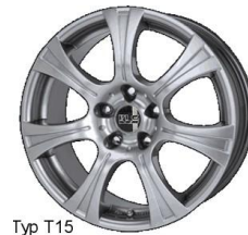
Alu-Felge Typ T15 6,5 x 16 Zoll