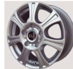
Alu 16 Zoll