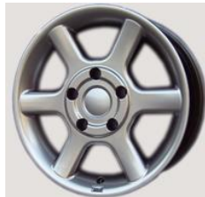
Alu 15&16 Zoll